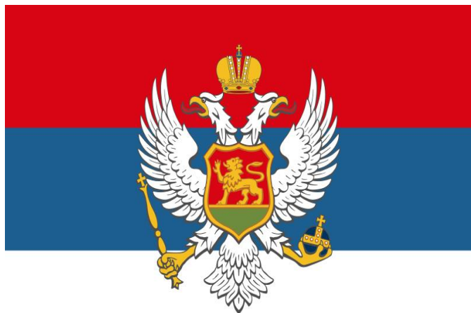
Застава Краљевине Црне Горе