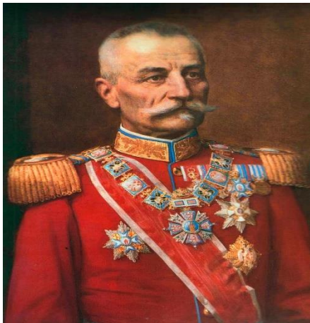
Краљ Петар I Карађорђевић