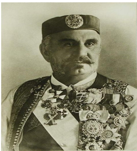
Краљ Никола Петровић-Његош