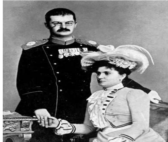
краљ Александар и краљица Драга Обреновић